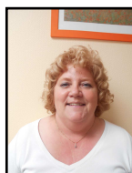
COM Christine PS/MS