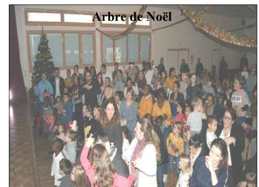
Arbre de Noël