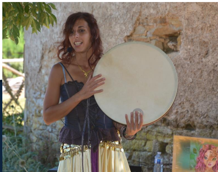
Contes au pied du Pigeonnier

30 août ou 6 septembre , matinale des associations