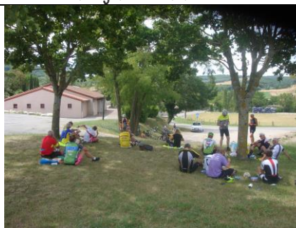
Sortie club 14 juillet pique-nique à Divajeu