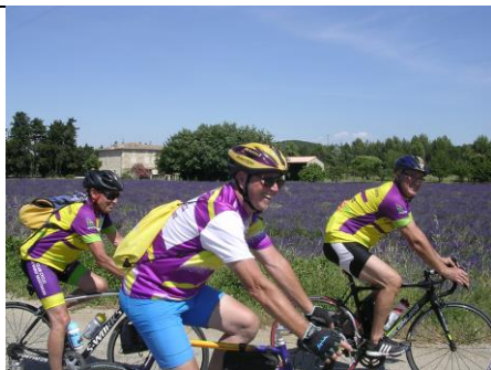
Séance photos-vidéos du 24 juin