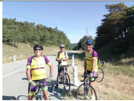
Puycycllette d'aout - Col de Ventabren