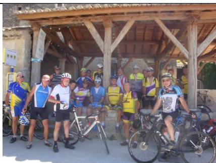
Sortie Club (ex-semaine cyclo) 13 juillet