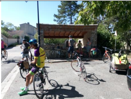
Accueil et accompagnement belges