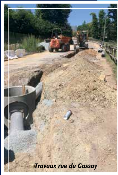
Travaux rue du Gassay