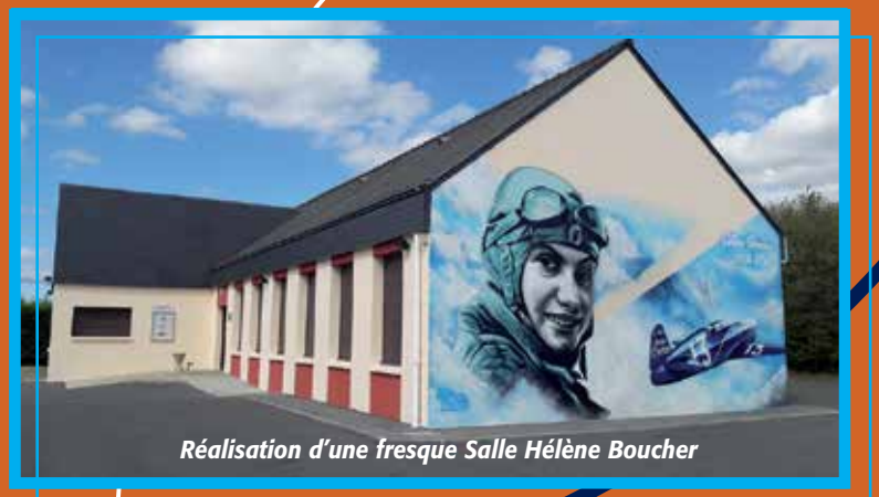
Réalisation d'une fresque Salle Hélène Boucher