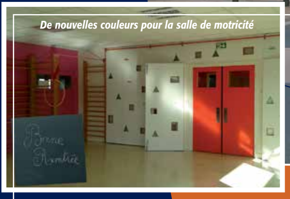
De nouvelles couleurs pour la salle de motricité