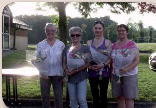
Fleurs offertes aux animatrices au cours du pique-nique de fin d'année.