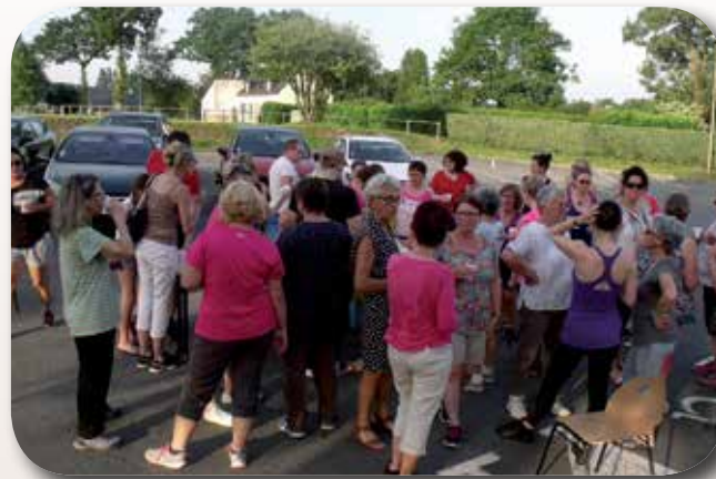
Pique-nique de fin d'année

Le prix de la cotisation est le même pour une personne de Trélivan que pour une personne extérieure à Trélivan. Les modes de paiements possibles sont : les chèques, l'argent liquide, les coupons sport et les chèques vacances. Les chèques peuvent être encaissés en plusieurs fois. Pour cela, donner tous les chèques lors de l'inscription, en précisant la date d'encaissement au dos de chaque chèque. Les inscriptions se font le jour du cours.