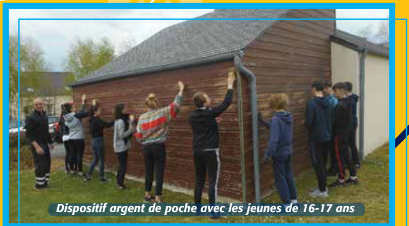
Dispositif argent de poche avec les jeunes de 16-17 ans