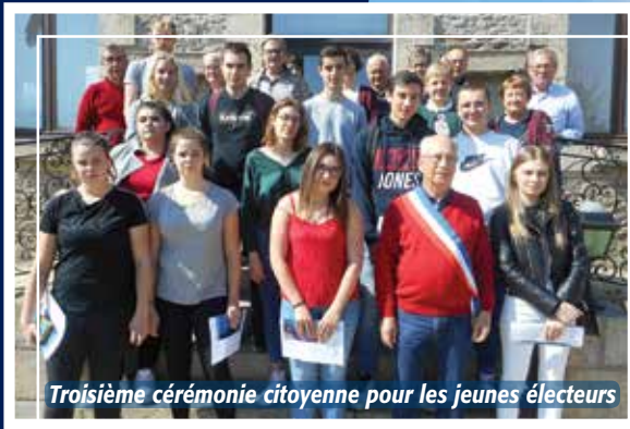
Troisième cérémonie citoyenne pour les jeunes électeurs