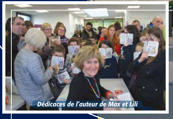
Dédicaces de l'auteur de Max et Lili