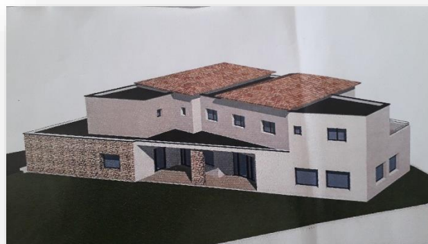
Ci-dessus façade côté route