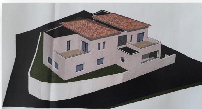
Ci-contre arrière du bâtiment