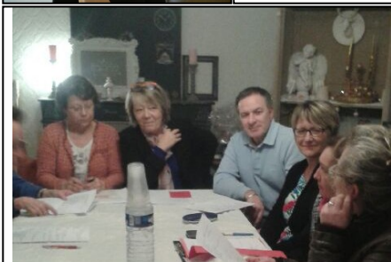
1920 / 1940 Geaune autrefois, comité de jumelage, tennis de table