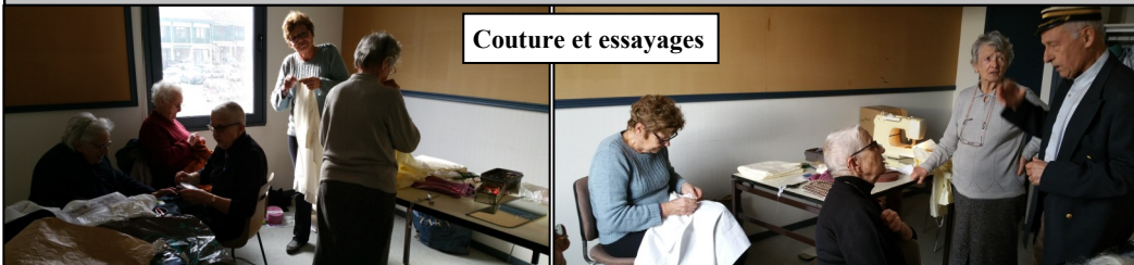
Couture et essayages