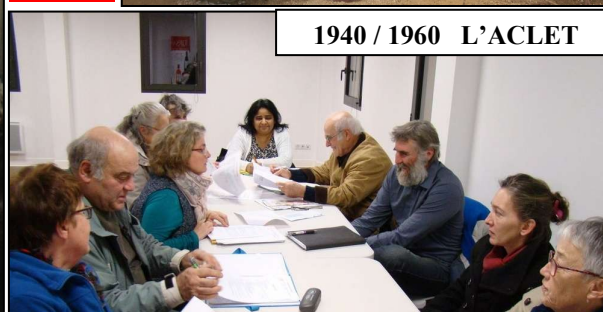
1940 / 1960 L'ACLET