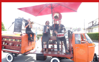
RENTRÉE CULTURELLE ET FESTIVE.....P7