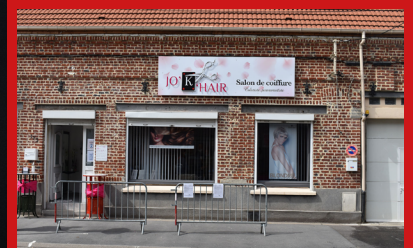
PORTRAITS DE VOS COMMERÇANTS .....P10