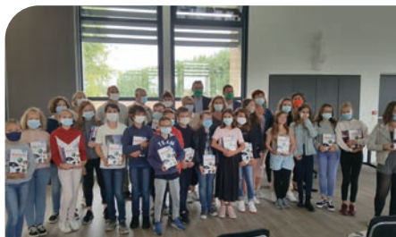
■ Remise des dictionnaires, le 8 septembre