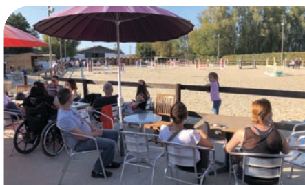
■ Journée du cheval, club hippique de Verlinghem, le 13 septembre