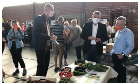
■ Forum des associations, le 4 septembre