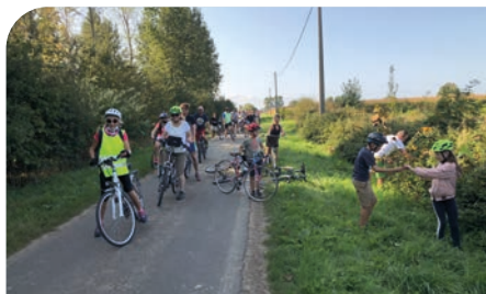
■ Balade à vélo, le 13 septembre