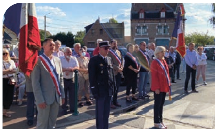
■ Cérémonie du 13 juillet