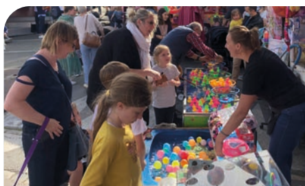
■ Ducasse du 3 au 8 juillet