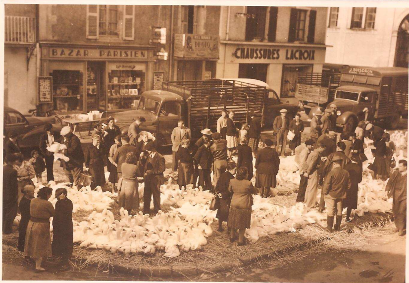
Le marché aux oies sur la place de Gençay (années 1950)