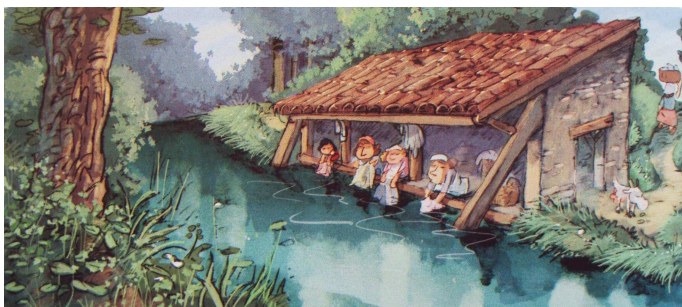
Le lavoir de l'Agrément sublimé dans la bande dessinée "Les Souvenirs de Mamette" par NOB (Bruno Chevrier) Editions Glenat - 2010

Cette anecdote judiciaire confirme bien que les dames étaient très chatouilleuses sur l'occupation de l'espace et les préséances, autour du lavoir.