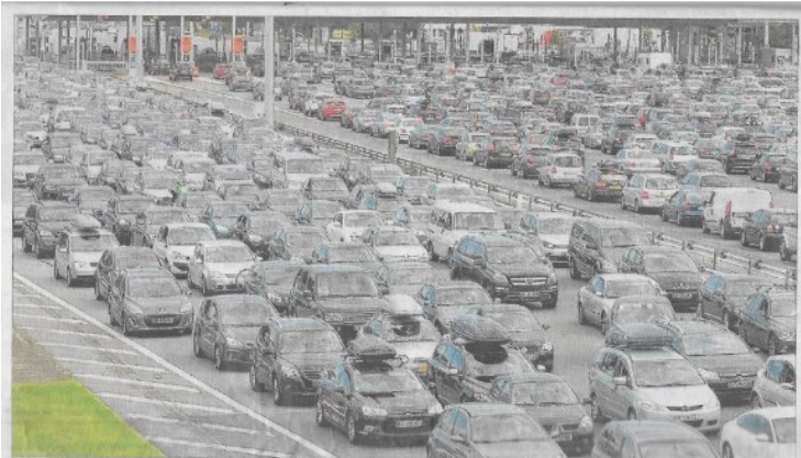
La concertation doit permettre au public d'accéder aux informations relatives au projet et de formuler des informations et propositions. ARND BRONKHORST