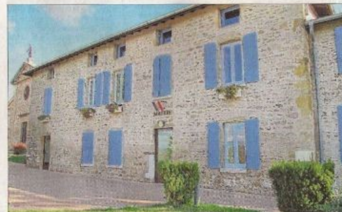
La séance du conseil municipal a été houleuse lundi soir. Cinq élus ont posé leur démission. D'autres pourraient suivre.

Dans les communes de plus de 1000 habitants, les conseillers démissionnaires peuvent être remplacés par les suivants de liste. Autrement dit, si les départs sont validés par la sous-préfecture, Reventin fera appel aux anciens candidats non élus des deux listes en course en 2014. Une élection complète pourra être organisée dans le cas où un tiers des sièges restent vacants à l'issue de cette procédure. Florence Gouache, sous-préfet, indique que le choix de l'implantation a été fait dans « l'intérêt général » et « regrette que le dialogue engagé pour ce projet ne soit pas assumé par tous ».