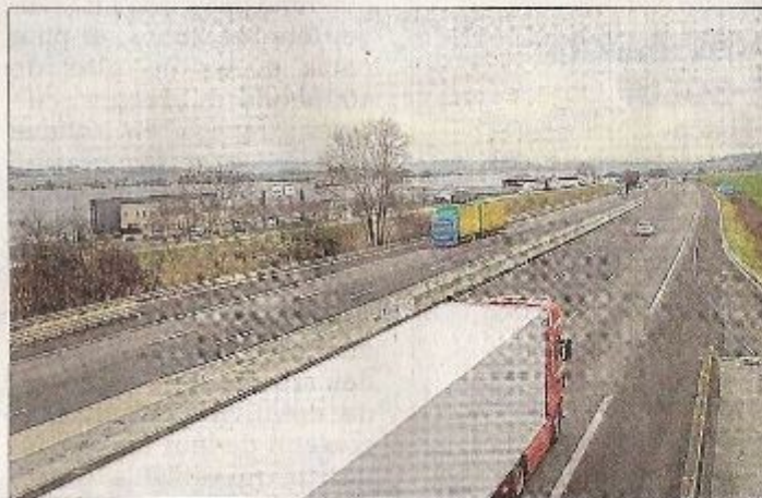
Les élus du conseil municipal ont choisi la variante proche de la zone d'activités du Saluant. Ils ont rejeté à l'unanimité les deux autres scénarios.

C'est donc la variante Sud, proche de la zone d'activités du Saluant, qui recueille les faveurs du conseil municipal : « C'est la moins proche des zones habitées et ça capterait l'essentiel de la circulation et des poids lourds con-