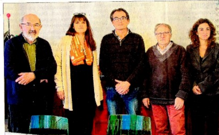
Les membres du CES veulent un demi-échangeur mais « au bon endroit ».

À présent, l'objectif est de rencontrer un maximum d'élus du territoire afin de défendre leurs arguments. « Nous souhaitons également rencontrer le préfet de l'Isère », indiquent-ils.