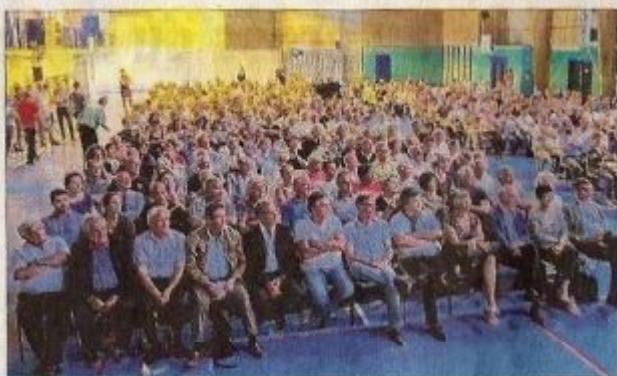
500 personnes s'étaient déplacées au gymnase de Reventin-Vaugris lors de la réunion publique organisée en juin dernier.

« La commune de Reventin va être de nouveau sacrifiée »