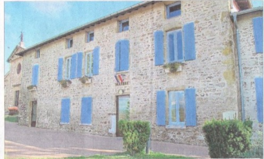
Dans les prochaines semaines, les Reventinois seront appelés à élire un nouveau conseil municipal.