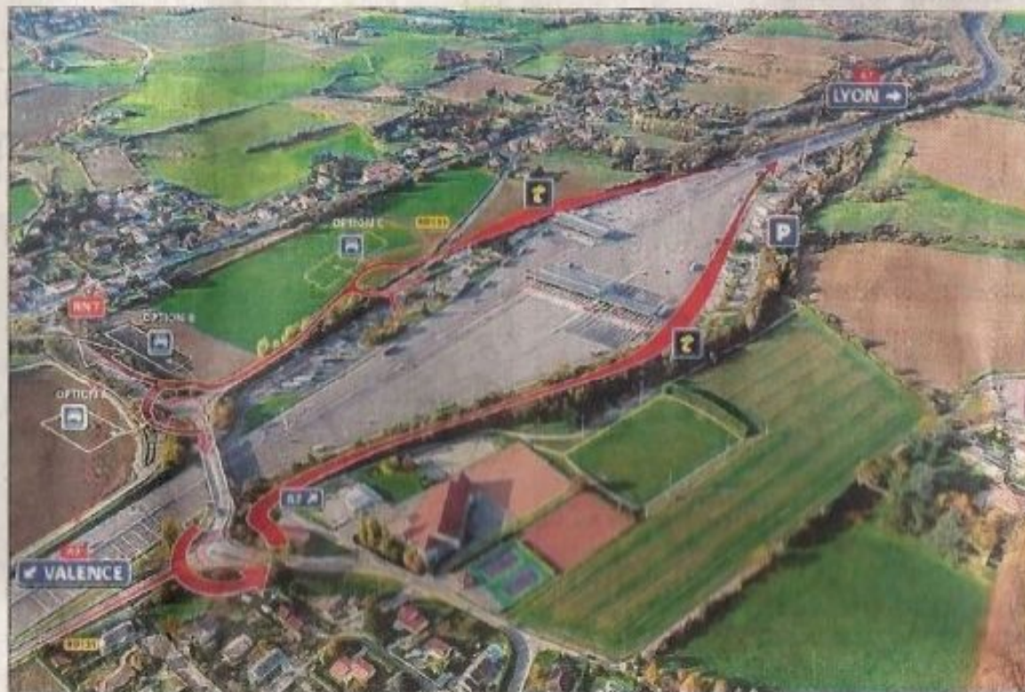
La sous-variante centre compacte telle qu'elle a été présentée lors de la concertation publique.

Comment le choix de l'implantation a-t-il été fait ? Dans son communiqué, le comité indique avoir tenu compte des avis reçus lors de la concertation : "Plus de la moitié des contributeurs (51 %) se sont