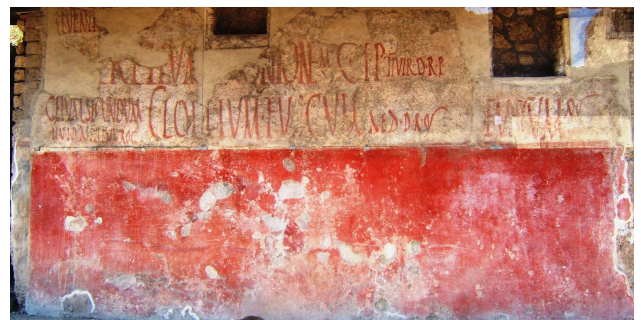
Enseigne d'un marchand d'huile à Pompéï