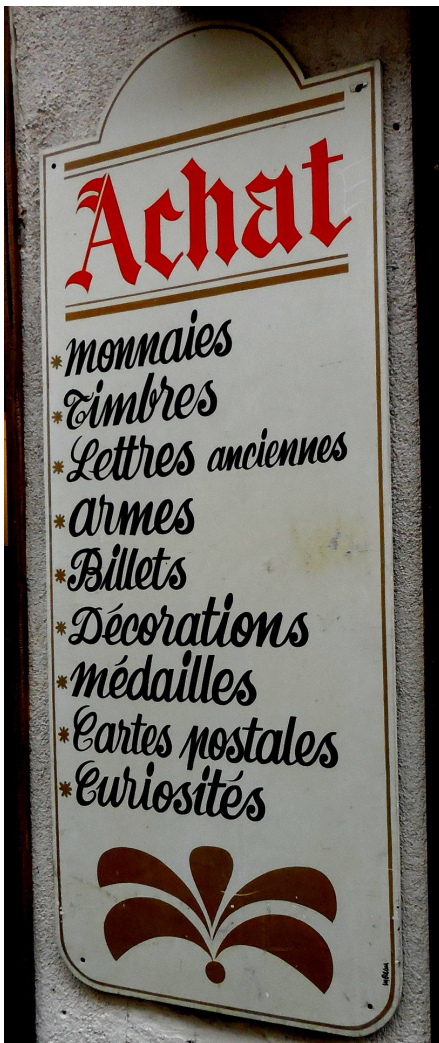
Différentes activités Poitiers