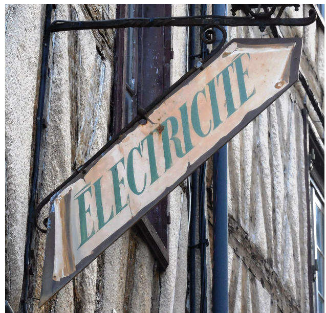
Lettres sur panneau métallique (Poitiers)