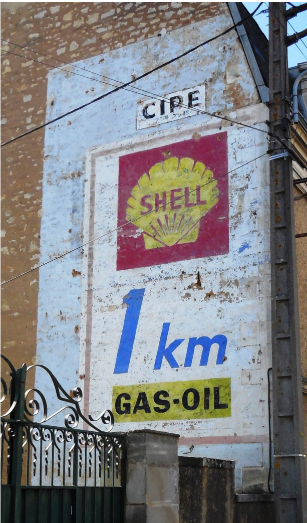
Peinture murale publicitaire (Poitiers)