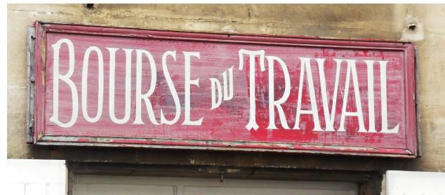
Lettres sur panneau de bois (Poitiers)