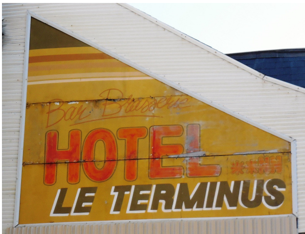
Publicité sur panneau de bois (Poitiers)