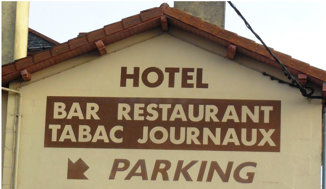
Lettres sur mur peint (Poitiers)