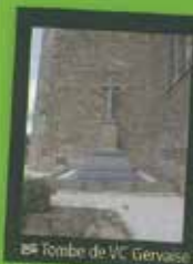
Tombe de VC Gervaise