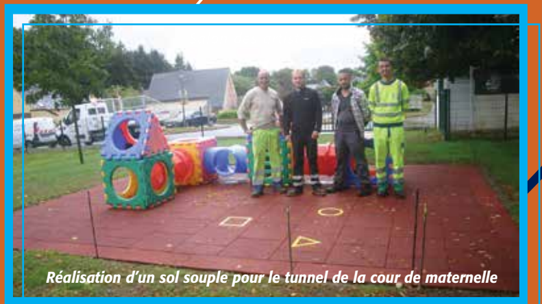
Réalisation d'un sol souple pour le tunnel de la cour de maternelle