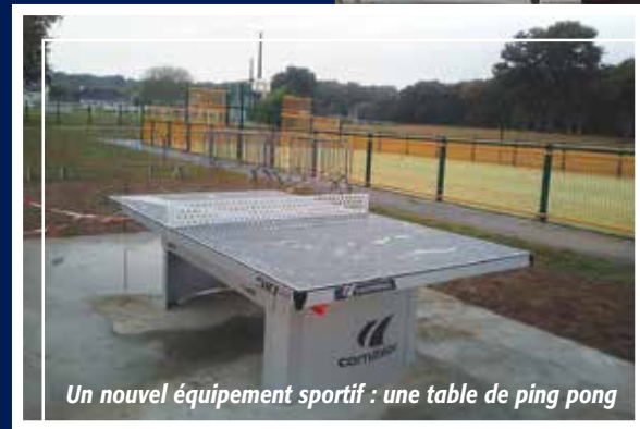
Un nouvel équipement sportif : une table de ping pong