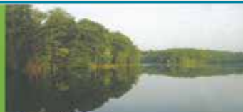
Étang du Val