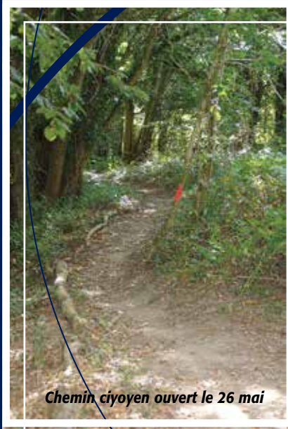
Chemin ciyoyen ouvert le 26 mai