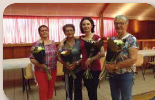
Flours offertes aux animatrices au cours du pique-nique de fin d'année.