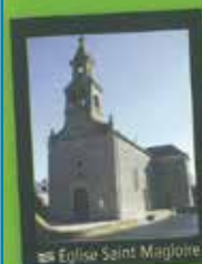
Église Saint Magloire

• Château de Vaucouleurs (privé). Attesté dès 1248, ce domaine est important : y sont attachés étang et colombier, haute justice, et des prééminences dans plusieurs églises. En 1410, le château est la propriété de Guillaume de Guitté, et en 1427, le duc Jean V y convoque le ban et l'arrière-ban de la Bretagne, afin de s'opposer aux Anglais, maîtres de la Basse Normandie. Plus récemment, durant la Seconde Guerre mondiale, les troupes allemandes occupent le château et défilent la tourelle d'escalier pour en faire une tour de guet. Le château est inscrit aux Monuments Historiques en 1926.