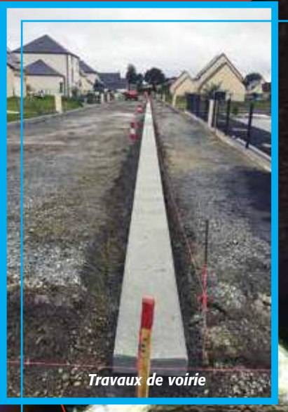
Travaux de voirie