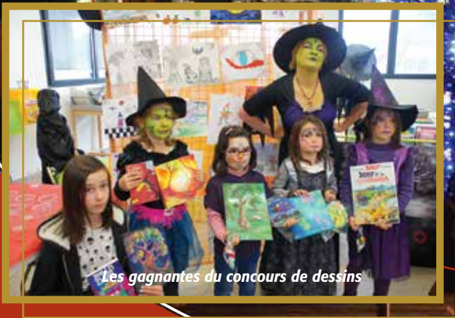
Les gagnantes du concours de dessins