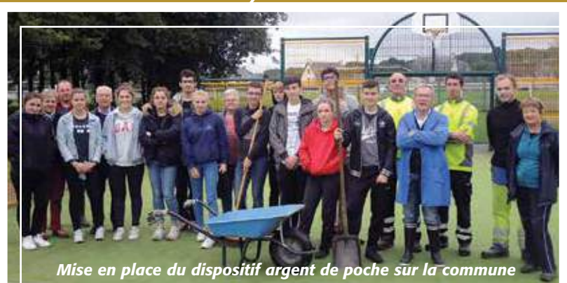
Mise en place du dispositif argent de poche sur la commune