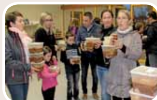
245 plats emportés au profit des actions de l'école.