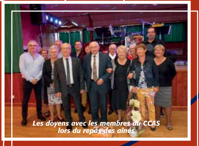
Les doyens avec les membres du CCAS lors du repas des aînés