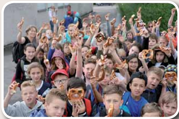
Petite pause Bretzel lors d'une randonnée dans les vignes.

Dans le cadre du jumelage avec la ville d'Abstatt, les élèves de la classe de CM1-CM2 ont découvert l'Allemagne et ont rencontré leurs camarades d'Abstatt durant la semaine du 19 au 24 juin 2016 (voyage qui a laissé plein de souvenirs à tous les élèves).