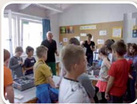
Visite des classes de l'école allemande.