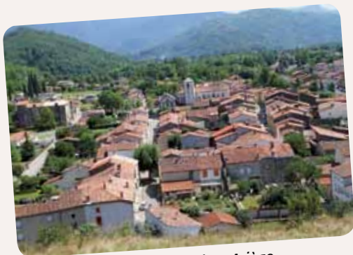
Montgailhard en Ariège

L'année 2017 verra nos amis ariégeois nous rendre visite durant le long week-end de l'Ascension. Une telle venue ne s'improvise pas et le comité de jumelage y travaille déjà depuis la rentrée. Le programme des festivités et des excursions est à peu près établi et sera communiqué lors de l'assemblée générale du mercredi 18 janvier 2017 . Retenez donc cette date.