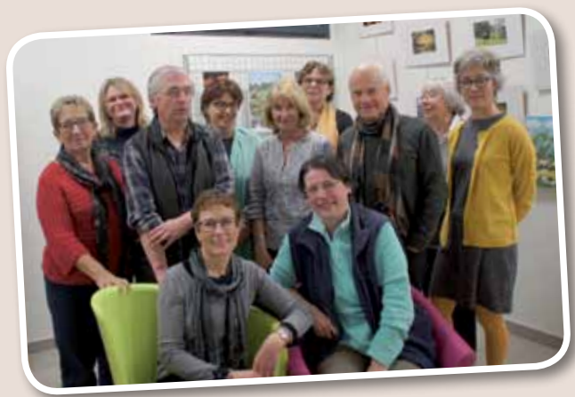
Les bénévoles de la bibliothèque