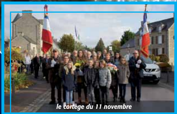
le cortège du 11 novembre