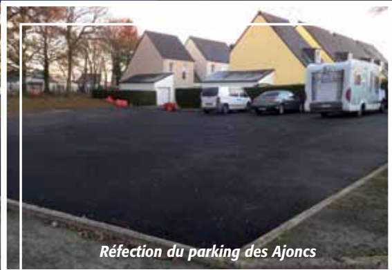
Réfection du parking des Ajoncs