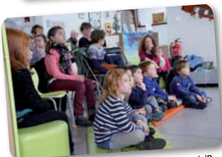
Le samedi 3 décembre, la bibliothèque l'Imagin'R, recevait l'association "Contilène".