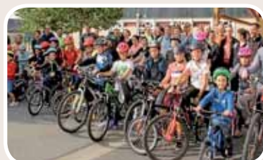
Sortie vélo familiale pour les parents et élèves. Chaque année, l'association propose ce rendez-vous, qui permet d'intégrer de nouveaux parents et de passer un moment ensemble.

Toutes ces manifestations ont un seul but : l'organisation et le financement des activités, des sorties culturelles de nos enfants. La participation de l'Amicale Laïque représente un budget de près de 10 000 € par an.