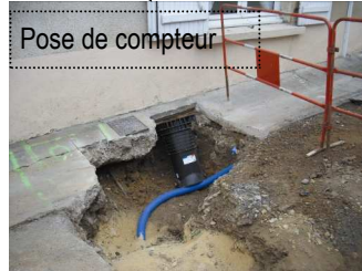
Pose de compteur