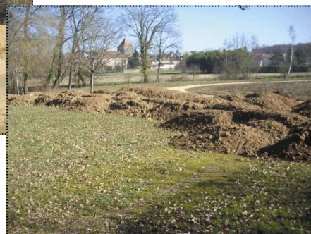
Mise à niveau du site par apport de terre végétale