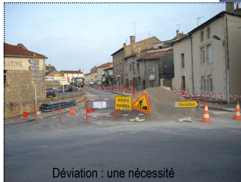
Déviaton : une nécessité

Tenue de Verneuil : remise en état des conduites et pose du compteur de la parcelle privée sur le domaine public.