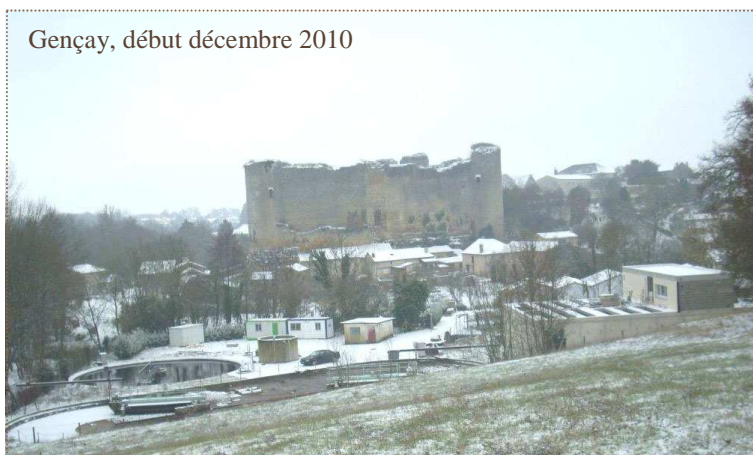
Gençay, début décembre 2010

Soit, racler et balayer leur partie de trottoir ou de chaussée (jusqu'au milieu de celle-ci en absence de trottoir), au droit de leur propriété, jeter du sable, de la sciure, du sel pour éviter la formation de verglas.