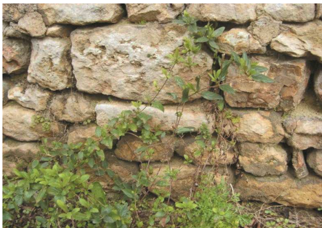
Chèvrefeuille et autres herbes sauvages Rue de la Paix

De plus, parmi les essences présentes en centre bourg ou à proximité, il est possible d'observer et de profiter du parfum (à la belle saison) de certaines espèces arbustives sauvages comme l'églantier, le chèvrefeuille, le prunellier et l'aubépine, mais on les retrouvera plus facilement en bordure de chemins ruraux à la Liardière et Beausoleil.