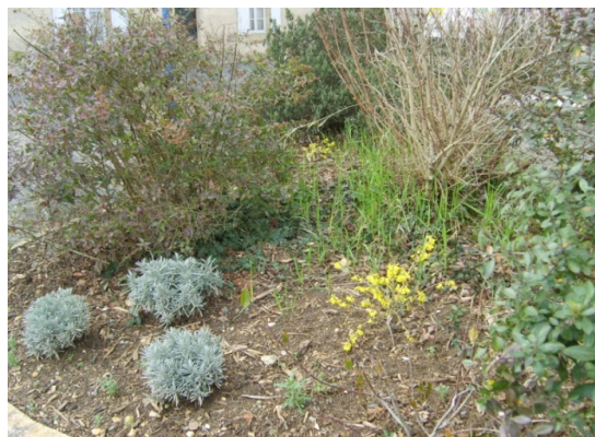
Parterre à l'entrée du Trésor public

Néanmoins, certains espaces aménagés comportent des parterres harmonieux mélangeant diverses espèces (plantes aromatiques comme le romarin et la lavande, rosiers, fragons, laurier sauce, érables, bouleaux) et présentant des hauteurs de végétation variées (strate herbacée, arbustive, arborescente) souvent propice à l'accueil de la faune avicole (oiseaux). C'est le cas des devantures du Trésor public ou de l'ancienne prison par exemple.