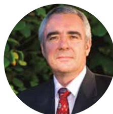
Éric Schlegel Maire de Gournay-sur-Marne