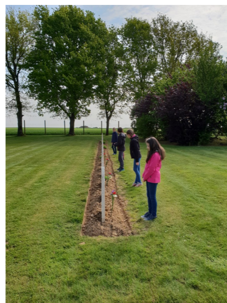
Les élèves de CM1 CM2 de Noyers St Martin

Ensuite, nous avons assisté à une deuxième cérémonie réservée à l'Ukraine. Cette cérémonie a duré peu de temps.