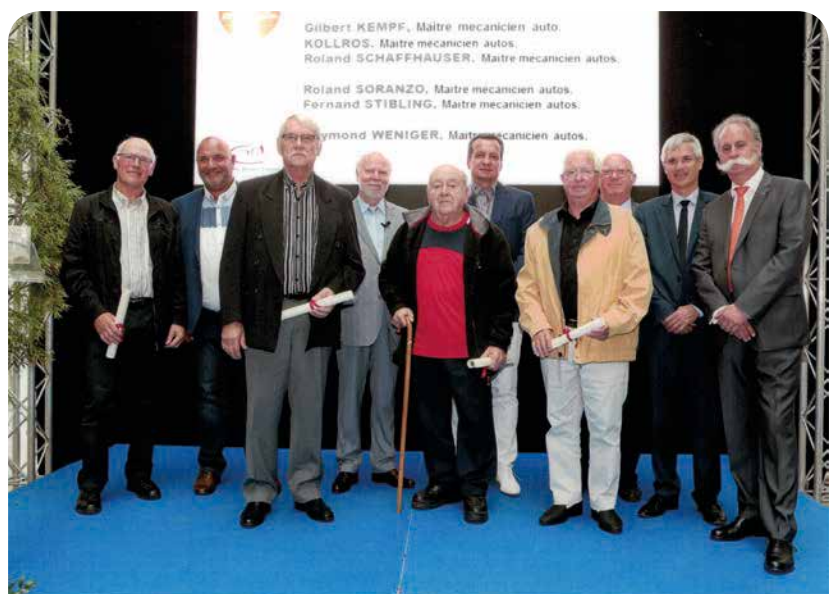
Maîtrise d'Or 2018 - Chambre de Métiers d'Alsace