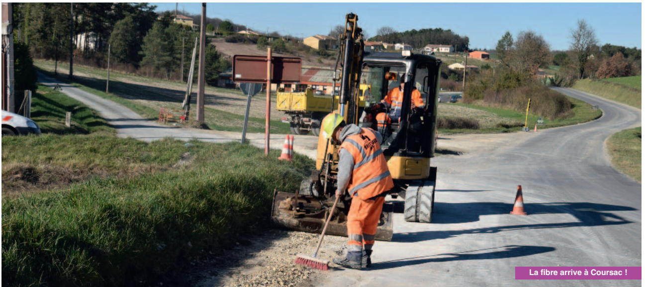
La fibre arrive à Coursac !

Le dernier trimestre de l'année 2019 et le début de cette année ont été marqués par de nombreux travaux d'entretien des routes, soit par la mise en œuvre d'enrobés soit par la pose de calcaire pour les chemins. C'est ainsi que la route de Lespinasse a bénéficié d'une reprise en enrobés et de point à temps.