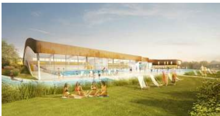
Vue des futures plages et du projet de bassin.