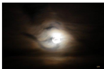
Pleine lune à Granval, C. Mazallon

http://classes.bnf.fr/laicite/telecharger/01.htm