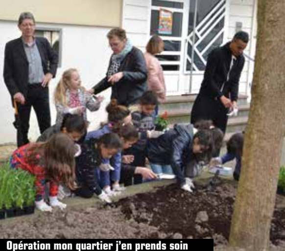
Opération mon quartier j'en prends soin

ticulièrement les maîtres-d'œuvre et les artisans qui conseillent leurs clients et deviennent donc les véritables représentants et metteurs en scène de cette politique de protection, de mise en valeur et de projets. L'AVAP tout en développant de la connaissance permet de projeter le patrimoine dans l'avenir en répondant mieux aux usages et modes d'habiter aujourd'hui ■