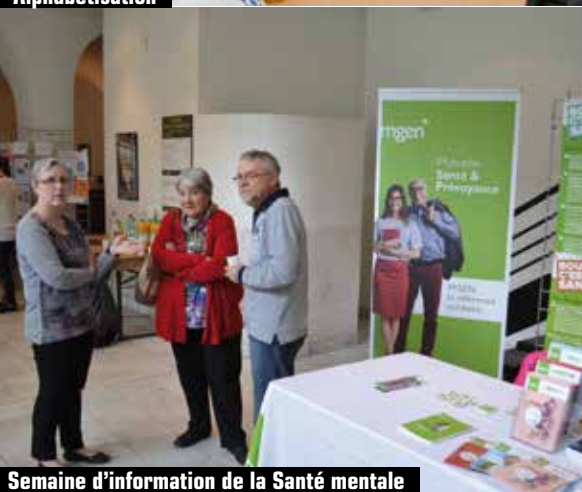
Semaine d'information de la Santé mentale