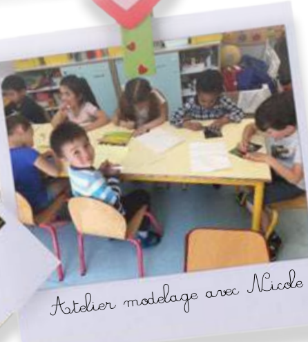
Atelier modelage avec Nicole