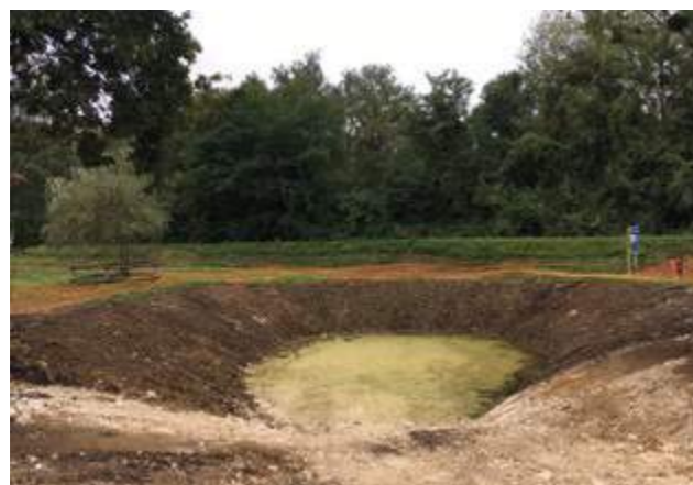
Mare prairiale en cours de restauration

Les chantiers réalisés récemment ont consisté à restaurer des mares, habitats de prédilection pour les insectes aquatiques et les amphibiens. Démarrés en 2015, ils se sont terminés cet été. Au total, neuf mares auront été restaurées, une mare a également été créée entre la lisière de la forêt de Célie et l'étang situé le long du boulevard du Clos de l'Aumône.