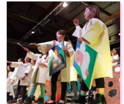
Dans l'atelier de Léonard de Vinci

L'Opéra débutait par la peste du XIV e siècle, pour parcourir la Renaissance et les grandes découvertes. Les artistes en herbe nous donnaient un aperçu de l'atelier de Léonard de Vinci, de la vie à la cour Médicis, des combats de Charles d'Orléans, de la révolution que fût l'imprimerie, mais aussi de la découverte du " nouveau monde " par Christophe Colomb. Un spectacle sensationnel et une réelle performance de la part de tous les acteurs, sans oublier les encadrants et les costumiers.