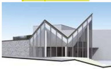
Salle de spectacle