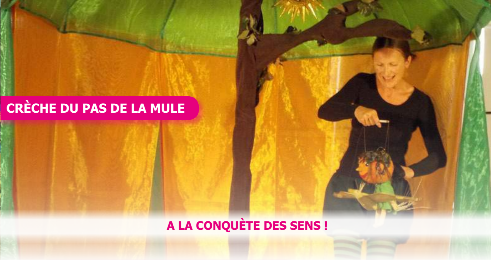
A LA CONQUÊTE DES SENS !