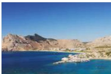
Voyage des retraités