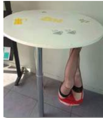
Création de l'été

Cet été est passé bien trop vite à la Maison des Jeunes de Croissy-Beaubourg !