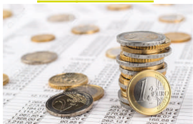
Dossier budget 2018