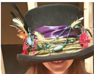
L'actualité de février à juin