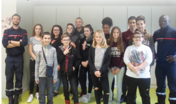
Formation aux gestes de premier secours (PSC 1)

D'autres événements ont eu lieu à la Maison pour les Jeunes. Ainsi, c'était le voeu de Madame Natale, 13 jeunes ont pu suivre une formation aux gestes de premier secours " PSC 1 " offerte par la Mairie.