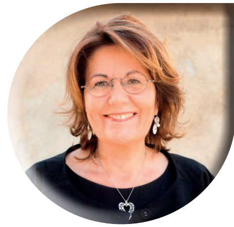
Maire de Montéleger