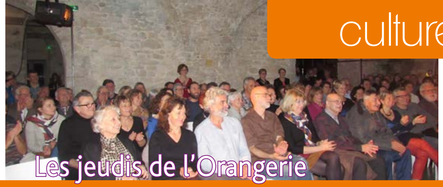
Les jeudis de l'Orangerie