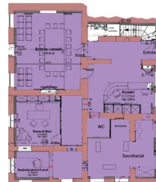
▲ La mairie