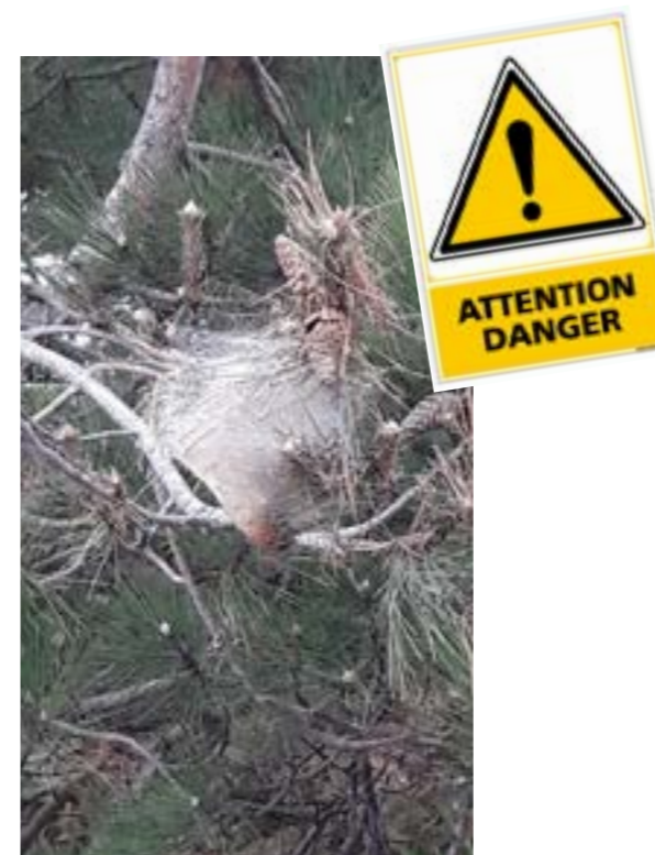
Pin avec de multiple abri en soie