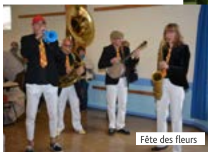
Fête des fleurs