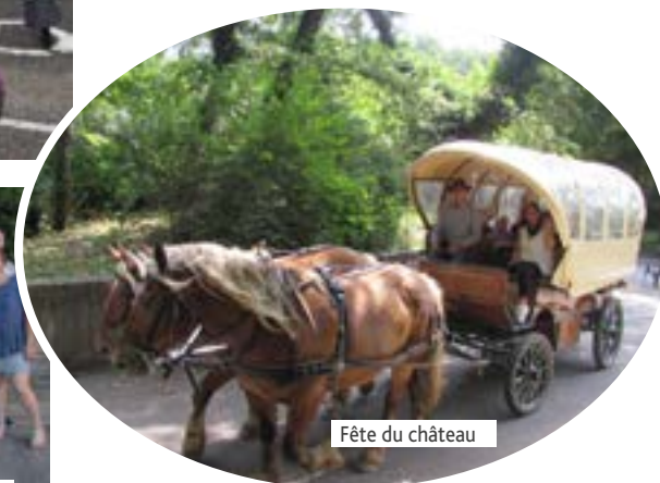
Fête du château