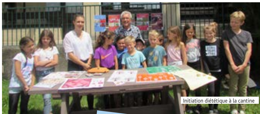
Initiation diététique à la cantine

MONTÉLÉGER - A L'ABRI DU CHÂTEAU Directrice de publication : Marylène PEYRARD Photos - droits réservés Couverture : sélection de dessins de l'école primaire Conception graphique - Maquette : Laure Allard - Imprimerie Portoise Impression : IMPRIMERIE PORTOISE Tirage : 720 exemplaires