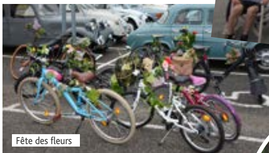
Fête des fleurs