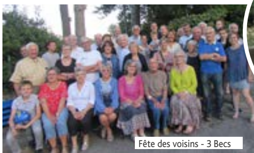
Fête des voisins - 3 Beccs