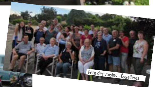
Fête des voisins - Éygalières