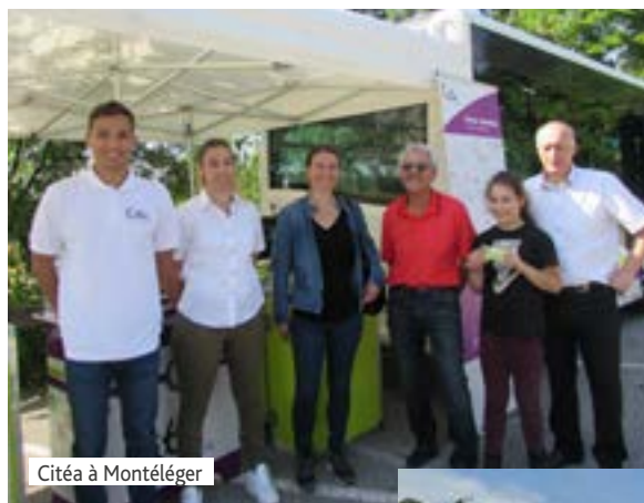
Citéa à Montéléger