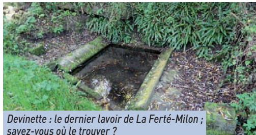
Devinette : le dernier lavoir de La Ferté-Milon ; savez-vous où le trouver ?