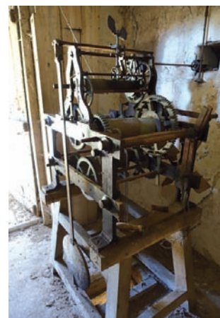
Exemple de petit patrimoine en renaissance grâce à l'expertise d'un jeune passionné, le mouvement d'horlogerie de l'église Notre-Dame

Nous lançons ainsi un appel aux possesseurs de photos anciennes du village qu'ils voudraient bien partager pour la constitution d'archives patrimoniales ; ils peuvent contacter la mairie.