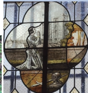
Restauration de la baie sud de la chapelle Médicis.