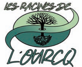
Logo : Emmanuel Bravo, Cité des Arts

Nous sommes heureux de vous annoncer la création d'une nouvelle association LES RACINES DE L'OURCQ . Son objectif est de développer, promouvoir, provoquer, organiser et/ou accompagner des initiatives culturelles, artistiques et artisanales.