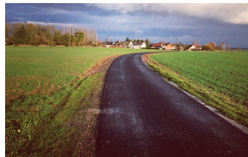
La Communauté de Communes de l'Oise Picarde entretient 340 km de voiries communautaires

Le gros chantier en cours est l'aménagement d'un ancien commerce à Breteuil qui accueillera entre autres les services techniques de la CCOP ainsi que le service archéologique.