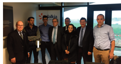
Monsieur Philippe Vasseur, Président de la Mission Rev3 en visite à la chaufferie bois de Breteuil-sur-Noye.

Fin 2018, c'était ainsi l'occasion d'évoquer les actions engagées par un groupe d'agriculteurs dans le cadre d'un Groupement d'Intérêt Economique (peut-être vers une future installation de méthanisation), l'expérimentation d'une technicité nouvelle dans la régulation de production électrique avec EDF sur le poste source de Breteuil-sur-Noye (site pilote en France), ou encore des projets d'autoconsommation électrique produite grâce au soleil sur la toiture de bâtiments existants.