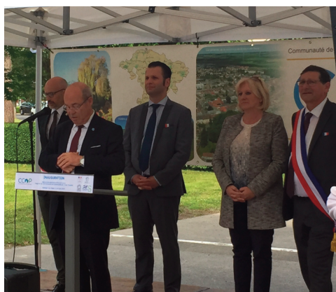
Inauguration des locaux de la CCOP et de la Maison de santé le 14 juin 2019

De même, les façades ont été restaurées par une entreprise de tailleur de pierre, ainsi que l'ensemble des toitures et des pièces intérieures.