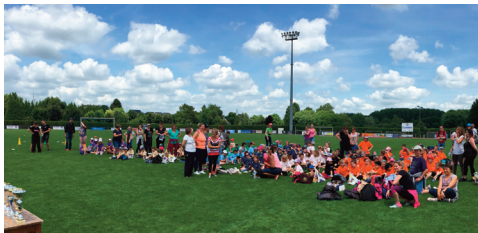
Le service sport organise chaque année une journée multi-sports à destination des élèves des classes de CP du territoire.

Parallèlement, la CCOP désormais gestionnaire des zones d'activités économiques du territoire, s'attèle non seulement au maintien des activités présentes mais recherche également à attirer de nouveaux projets, créateurs d'activité et d'emplois.