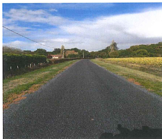
Route du Pont

Réparation du mécanisme de fonctionnement de la cloche de l'église avec mises aux normes du tableau de programmation pour un montant de 1.805,00 euros.