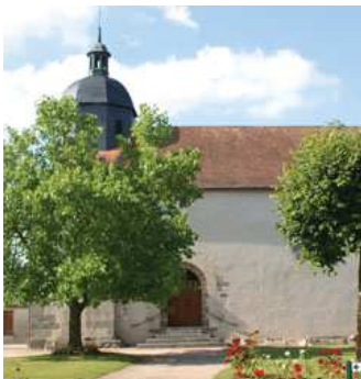
l'église et sa lanterne des morts

L'église de Saint-Martial-sur-Isop possède une architecture complexe qui s'explique par des modifications réalisées au fil des siècles. Une église de type « grange » fut construite à l'époque carolingienne. Un peu plus tard, l'église est alors modifiée pour lui donner une forme plus arrondie, davantage au goût de l'époque. En 1896, la voûte de l'église s'écroule et oblige les habitants à la rénover. La crypte romaine qui se situe en dessous de l'église possède une source qui fut utilisée pour baptiser les croyants. L'église est par ailleurs reconnue pour son acoustique exceptionnelle.