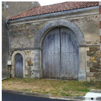
une porte d'entrée de cour dans le bourg

Les rochers de l'Isop est un site naturel inscrit depuis 1989. La protection concerne la vallée de l'Isop sur une partie où la rivière s'est frayée un passage dans un massif de diorites. L'encaissement de l'Isop a généré un relief singulier parsemé de rochers dont le nombre, les dimensions, les formes et les dispositions donnent une dimension pittoresque aux lieux. Les rochers sont issus d'un lent processus de désagrégation en boules. Les noyaux de roche que l'on peut observer aujourd'hui ont résisté à l'érosion mécanique ainsi qu'à la décomposition chimique puis ont été mis au jour par le déblaiement des arènes qui les enveloppaient.