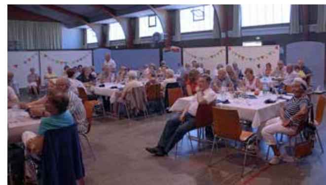
Repas à thème