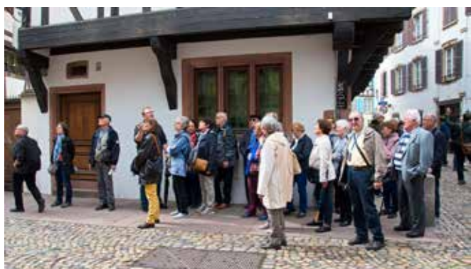
Visite guidée de Strasbourg