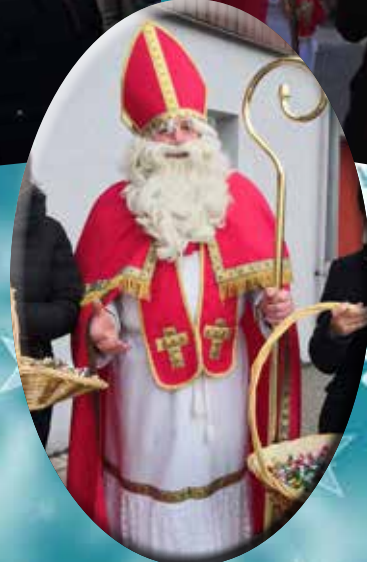
Saint Nicolas aux écoles