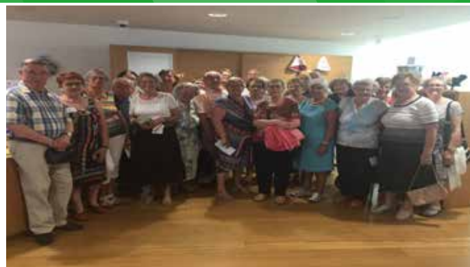
Musée du Kochersberg