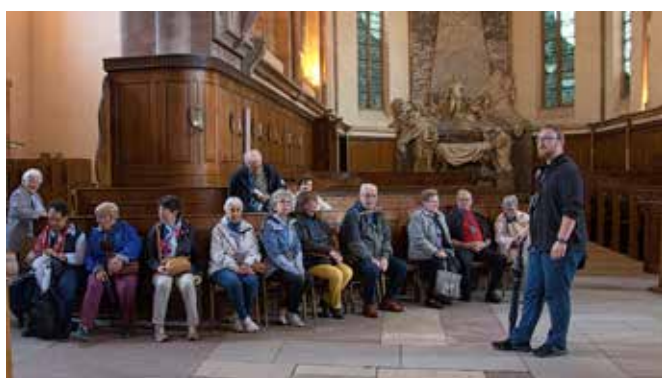
Visite guidée de Strasbourg