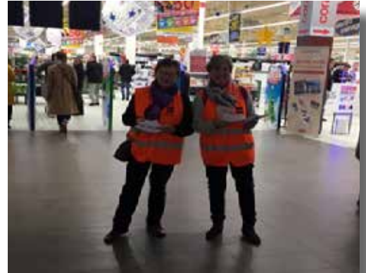
Collecte pour la Banque Alimentaire

Le club des aînés a participé activement à la collecte nationale de la Banque Alimentaire au magasin Cora de Mundolsheim.