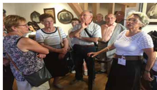
Musée du Kochersberg