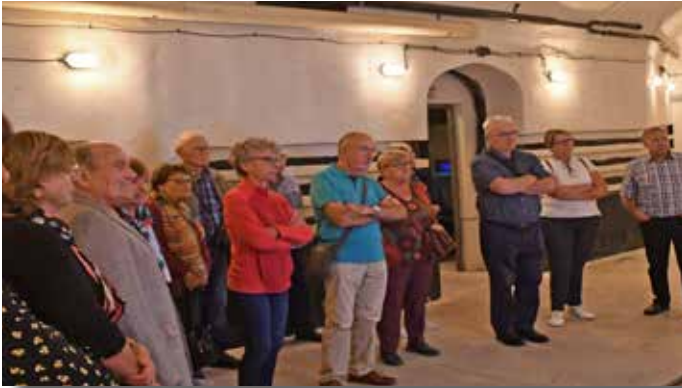
Mémorial de Schirmeck