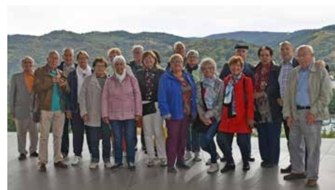
Mémorial de Schirmeck