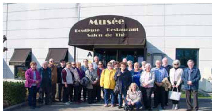
Visite du musée du chocolat à Illkirch