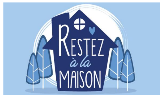
La mairie d'Eve

Prenez bien soin de vous, de vos proches et des autres.