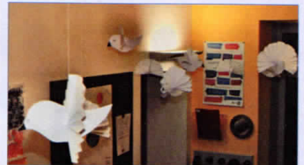
Leurs colombes de la paix installées dans l'école de Saint-Hilaire