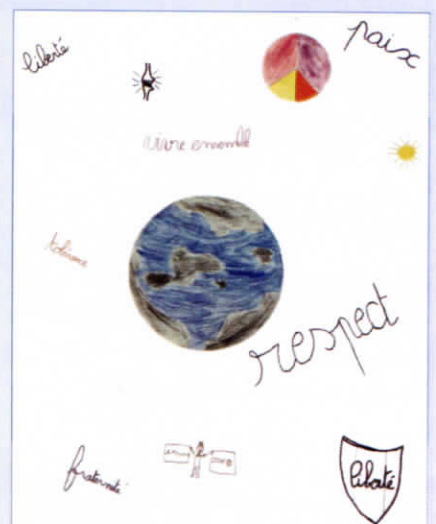
Leur dessin, leurs valeurs de liberté, de respect, de fraternité et d'amour