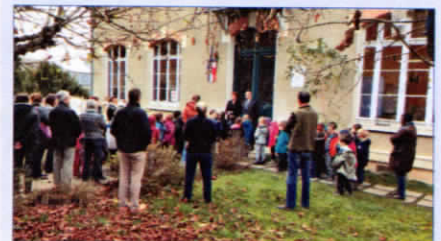
Le 16 novembre, à Châlo-Saint-Mars