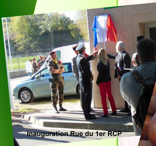
Inauguration Rue du 1er RCP