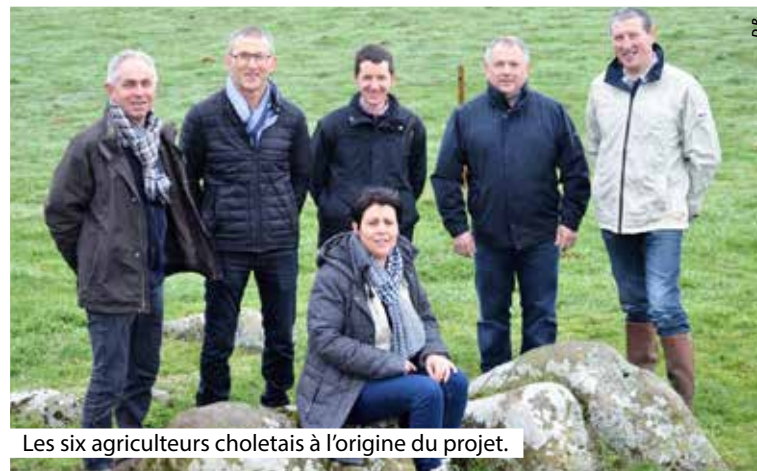
Les six agriculteurs choletais à l'origine du projet.

rappelons-le, comporte 26 communes et plus de 100 000 habitants) associent réellement la population locale, et qu'une part des retombées économiques bénéficie directement aux acteurs locaux. Les communes concernées décident d'accepter l'implantation de parcs éoliens, à la condition que ces projets soient ouverts aux citoyens. Le mercredi 21 octobre dernier, la société par action simplifiée Eolys/Vent du Lys présentait aux maires et élus locaux