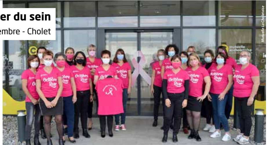
Mutuelle La Choletaise

Forte de ses valeurs de solidarité et de proximité, la Mutuelle La Choletaise et son équipe, composée en très grande majorité de femmes, s'associent à la campagne Octobre Rose. Une boîte aux lettres, mise à disposition jusqu'au jeudi 31 décembre dans le hall, 1 rue de la Sarthe, permet de recueillir les dons et des tee-shirts à l'effigie du mois rose y sont en vente. L'intégralité des fonds collectés, auxquels s'ajoutera un don de 1 000 € alloué par la Mutuelle La Choletaise, sera reversée à l'association choletaise Vivre comme avant.