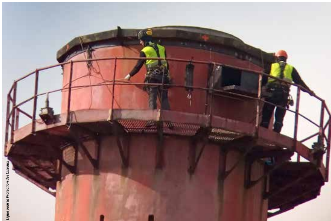
Ligue pour la Protection des Oiseaux

Un nichoir à faucons pèlerins a été installé en haut de la cheminée de l'usine Michelin : une opération parmi bien d'autres pour favoriser la biodiversité sur le site.