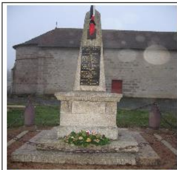
Monument aux morts de Rimondeix