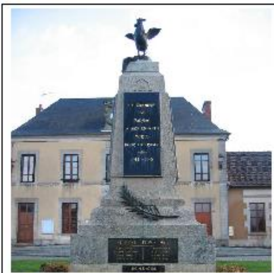
Monument aux morts de Parsac

Les cérémonies commémoratives du 11 novembre ont donc, cette année, revêtu une solennité inhabituelle et ont été l'occasion de procéder à l'inauguration officielle de ces nouvelles plaques sur lesquelles les noms de nos 96 morts (82 pour Parsac et 14 pour Rimondeix) ont été gravés par année de décès.