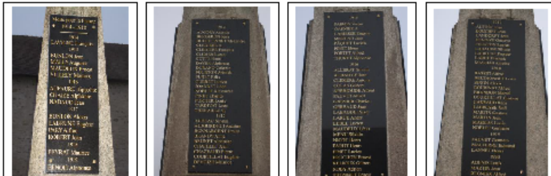
Nouvelles plaques comportant les noms de nos 96 morts lors de la « Grande Guerre »

Nous avons souhaité profiter de cette cérémonie exceptionnelle et hautement mémorielle pour inviter les jeunes de la commune à y participer et nombreux sont ceux, élèves de l'école de Parsac-Rimondeix, qui ont répondu à cet appel, complétant ainsi la forte participation de nos concitoyens adultes. Merci aux parents et aux enseignants de leur avoir permis d'y participer.