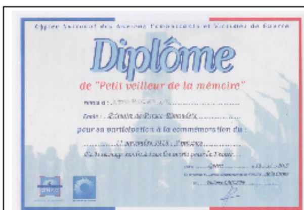
Modèle des diplômes remis aux jeunes participants

La France, depuis la Révolution s'est construite grâce à toutes celles et tous ceux qui se sont investis, dévoués, parfois jusqu'au sacrifice suprême, pour qu'elle soit ce qu'elle est aujourd'hui : La France initiatrice de valeurs, montrée en exemple de par le monde.