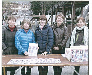
Les bénévoles de l'Association d'animation du Beaufortain tenaient un stand sur le marché de Beaufort, mercredi, pour faire connaître leur revue.

À l'occasion de la sortie du dernier numéro d'"Ensemble en Beaufortain", « Les héros de notre enfance », l'Association d'animation du Beaufortain (AAB), représentée par ses bénévoles, est allée à la rencontre des Beaufortains sur le marché de mercredi.