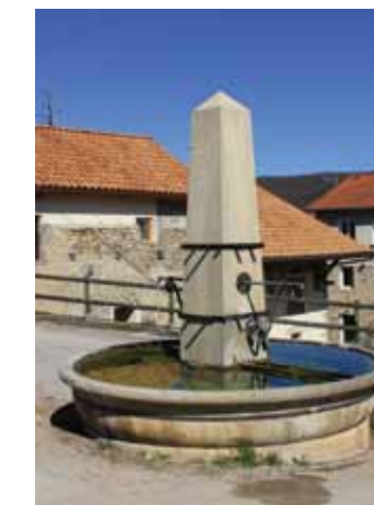
Fontaine de Peyrieu