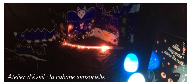
Atelier d'éveil : la cabane sensorielle

Une nouvelle animatrice au Relais Petite Enfance (RPE) de la ville de Bouaye intervient sur Brains. Elle organise des temps d'animations destinés aux Assistantes Maternelles de la commune, une fois par mois, dans le cadre d'un conventionnement (éveil musical, éveil psychomoteur, grandes histoires pour petites oreilles, découvertes sensorielles, peinture, pâte à sel, bricolage...)