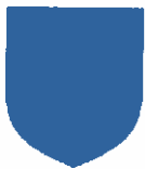
Ecu de référence

Après plusieurs étapes de représentation graphique, le choix s'est porté pour l'écu qui par définition est la représentation d'un bouclier décoré avec une partition divisée en quatre quartiers dite « Ecartelé »