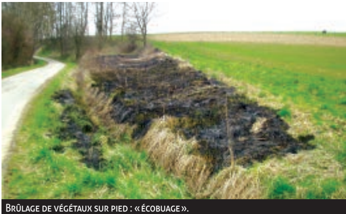
BRÛLAGE DE VÉGÉTAUX SUR PIED : « ÉCOBUAGE ».

2) Le brûlage de matières plastiques ou pneumatiques (3 e classe) est prévu par l'article 84 du Règlement Sanitaire Départemental et réprimé par l'article 7 du Décret n° 2003-462 du 21/05/2003. Une infraction relativement fréquente sur les chantiers de construction, l'élimination des déchets ayant un coût élevé pour les entreprises.