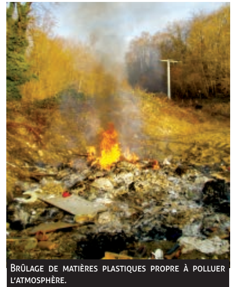
BRÛLAGE DE MATIÈRES PLASTIQUES PROPRE À POLLUER L'ATMOSPHÈRE.

3) L'arrêté préfectoral n° 970274 du 14 février 1997 relatif au brûlage de végétaux (4 e classe) :