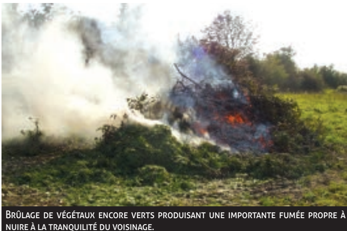
BRÛLAGE DE VÉGÉTAUX ENCORE VERTS PRODUISANT UNE IMPORTANTE FUMÉE PROPRE À NUIRE À LA TRANQUILLITÉ DU VOISINAGE.