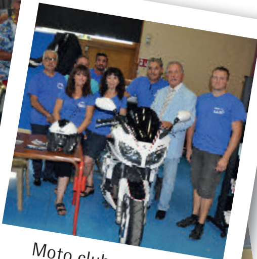
Moto club pontois