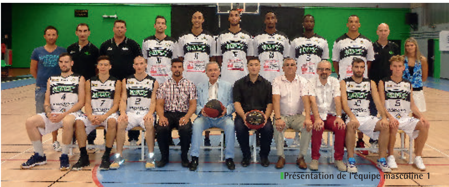
Présentation de l'équipe masculine 1

Les matchs ont lieu le samedi, à 20H00, gymnase du Grand Champ, à Pont de Chéry.